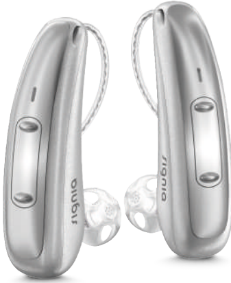
Pure Charge&Go X

Yeni Pure Charge&Go X, mükemmel ve kişisel bir işitme deneyimi için oldukça güçlü performans sunar. Hem de tüm gün boyunca.