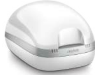
Yeni şarj ünitesi